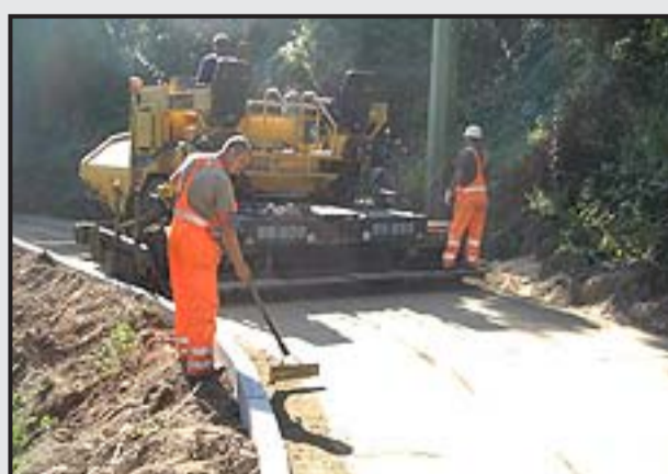
5 - Stesura del conglomerato terroso con vibrofinitrice.