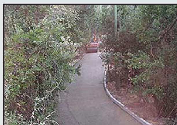
6 - Compattatura della superficie con rullo compressore.

azichem PRODOTTI SPECIALI PER L'EDILIZIA E LA BIOEDILIZIA