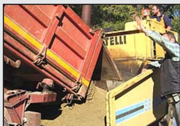
4 - Consistenza usuale del conglomerato terroso stabilizzato con STABILSANA.