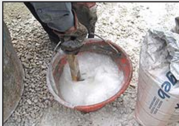
2 - Dissoluzione di 1 kg di STABILSANA in 30 litri di acqua.