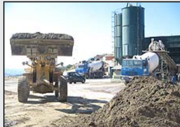
3 - Preparazione del conglomerato terroso.