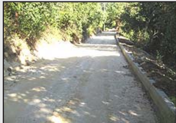
1 - La strada in terra battuta esistente prima della stesura della nuova pavimentazione in terra stabilizzata.